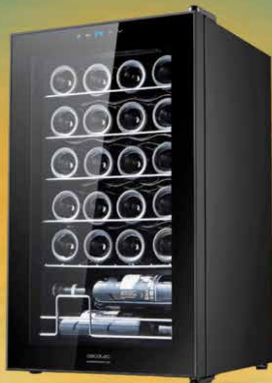
Vinoteca en negro de 26 botellas de capacidad

Los 3 clientes que más cajas compren de los productos en campaña durante el mes de junio conseguirán esta fantástica vinoteca de REGALO .